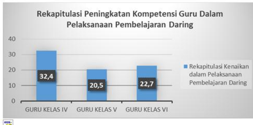
Gambar 4.1 Diagram Rekapitulasi Peningkatan Kompetensi Guru Dalam Pembelajaran Daring

71 menjadi 94. Untuk guru kelas V yakni Eryana Suprihanti, S.Pd.SD sebesar 20,5% yaitu 72 menjadi 88. Sedangkan untuk guru kelas VI yakni Siti Nur Khomsah, S.Pd .SD sebesar 22,7% yaitu 75 menjadi 92. Dapat dilihat pada diagram di bawah ini: